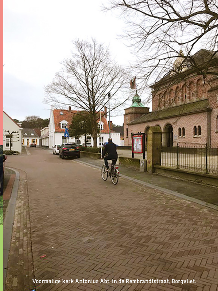
Voormalige kerk Antonius Abt. in de Rembrandtstraat, Borgvliet.